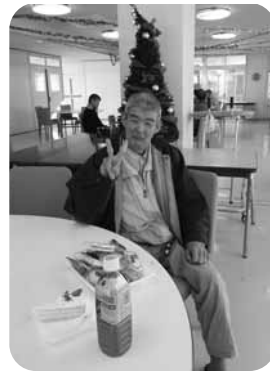
満面の笑みを浮かべて