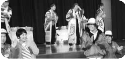
ソーラン ソーラン♪