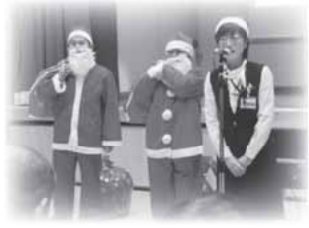
今年もイオンからサンタさんが登場！