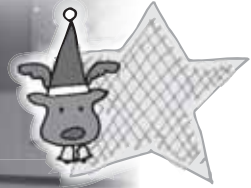
レインボー様の歌声も高らかに・・・♪