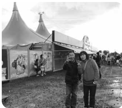
テントの前でハイポーズ!!