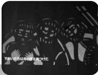
♡ 切り絵 ♡