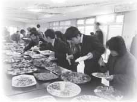
おなかと相談しながらいただきました