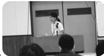
さあ！！皆で研修 研修！