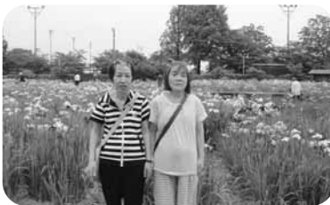
これからが見頃かな？

一言に「しようぶ」と言っても色々な種類・品種があり、色も紫色しか思いつきませんでした。黄色や白、ピンクなどの色もあったのは驚きでした。花しようぶ園の開館が今年五月二十六日からということで、どの程度開花しているかわかりませんが当日は思ったよりも花が多く皆さん口々に「きれいかね」「すごかね」と話されていました。皆さん楽しい外出になったようでした。(どらえもん)