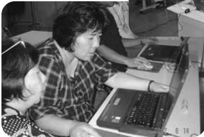
マウスで図形を移動しています