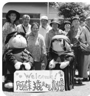
マスコットと一緒に!!