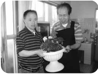
いつもありがとうございます

訪問先では、どちらからともなく「ありがとう」という言葉で笑顔になり、梅雨の晴れ間のような清々しい気持ちになりました。(柿)