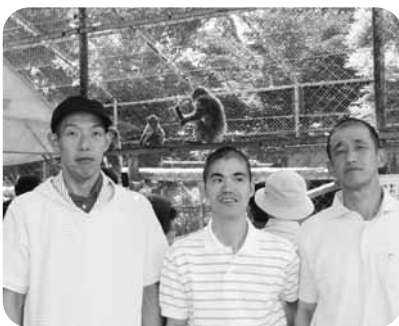
また来年も一緒に来ようネ!