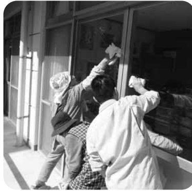
ピカピカになったよ!!