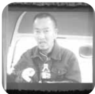
故人の思い出と共に…