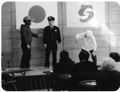
中原地区で開催された成人学級での寸劇の様子

これらの活動の中で「情報発信」という活動は、あまり知られていません。「情報発信」というのは、警察が持っている交通事故や犯罪の情報を地域の皆様に提供したり、交通事故や犯罪の被害者にならないために指導する活動であり、特に私は寸劇形式を取り入れた情報発信活動に力を入れています。 富士町には私が勤務する富士南駐在所以外に、古湯駐在所(勤務員二名・北山駐在所(勤務員一名)があり、着任してからすぐに富士町内の駐在所員とその家族で「FP4安心隊(プラスワン)」という劇団を立ち上げました。 私達が立ち上げた劇団は「笑って守って 住みよか町」をキャッチフレーズに、高齢者の交通事故・詐欺被害の防止、子供達の交通事故・誘拐防止のための寸劇を行っており、現在までに富士町内で約三十回の講演をしてきました。 私が「寸劇」にこだわる理由として、高齢者や子供達は集中出来る時間が短く、また長い話をしてもらっても忘れやすい傾向にあるので、「寸劇」という短時間