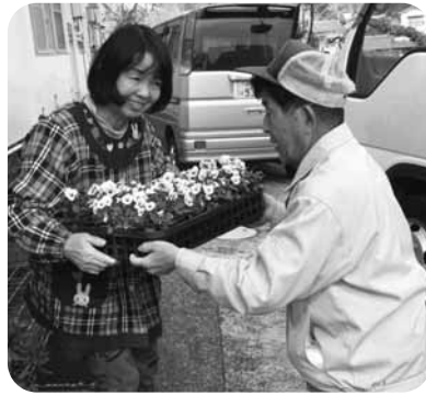
南部保育園に心をこめて!!