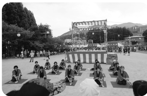
『内野太鼓』、『銭太鼓』では、迫力ある太鼓の音が会場に響き渡り、最後まで聞き入りました。

太鼓の演奏、宝釣りゲーム、富士町音頭、豪華な景品が数多く用意された抽選会など、素晴らしいイベントが盛りだくさんの夏祭りでした。多くの利用者の方が楽しみにされていた食事も、今年は新メニューが加わるなど、参加された皆様の笑顔が絶えることのない、思い出に残る一日となりました。(SKF)