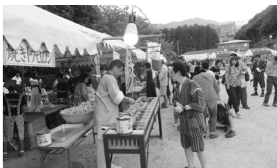
夏祭りを彩る豪華なバイキングメニューをお腹一杯になるまで皆で美味しくいただきました!!