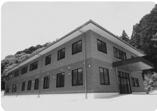
横から見た建物全体図です。