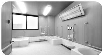
男性・女性共に浴槽が3つあり、壁に暖房パネルが付いています。