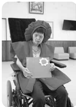
還暦おめでとうございます!