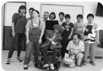
手工芸班の皆さんと共に!