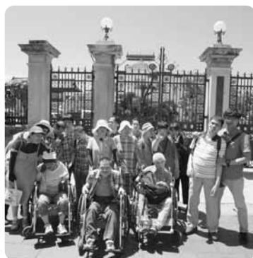
お花の前で記念写真! 皆さん、とってもよい笑顔!!

七月十日(火)三回目のバス旅行として柳川までうなぎを食べに行きました! また、八月七日(火)には福岡タワーへ!帰りは博多はねや総本店にて昼食。夏の福岡を満喫することが出来ました!