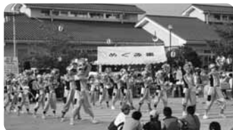
銭太鼓を守る会の皆さんによる銭太鼓と、歩絵夢(ポエム)の皆さんによるリズムダンス