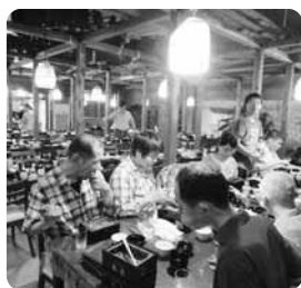
うなぎのせいろ蒸し!