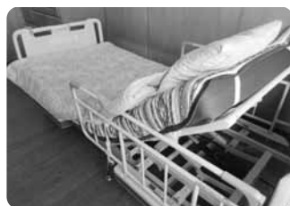
ありがとうございました!!

七月十九日(木)めぐみ園では家族会から寄贈された介護ベット二台が搬入されました。年々歳を重ねていく利用者の皆さんに有効活用させていただきます。ありがとうございました。