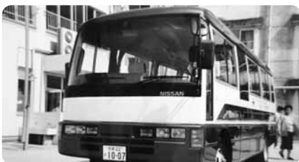
納車された当日の懐かしい写真!!