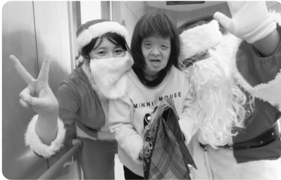
メリークリスマス!