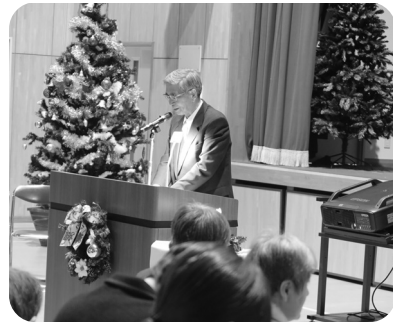
今日あなたがたのために救い主がお生まれになった

今年は、インフルエンザの感染者が直前に出たため、富士学園とウイズ富士に分かれてのクリスマス礼拝となり、愛餐会もそれぞれに豪華なバイキング形式の料理を心行くまで楽しみました。(愛餐会の料理に、NHK歳末たすけあい義援金を利用していただきました)