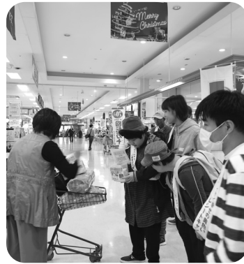
ありがとうございます

十一月十一日(土)にイオン佐賀大和店に行ってきました。元気な声で呼び掛けて沢山のレシートが集まりました。ご協力ありがとうございました。