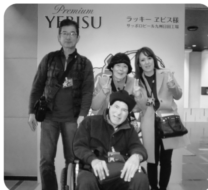
サッポロビール工場に行ってきました!!

十一月一日から十九日に亘り、四班に分かれ、山口、京都、大分へ地域生活者社会見聞旅行に行かれました。皆様各地の美味しい食事と観光を楽しまれました。(K&K)