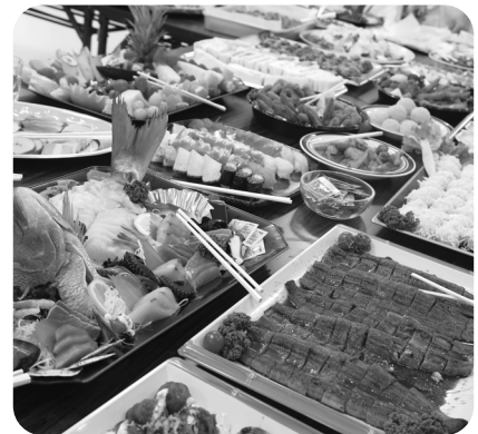
豪華な愛餐会のバイキングメニュー