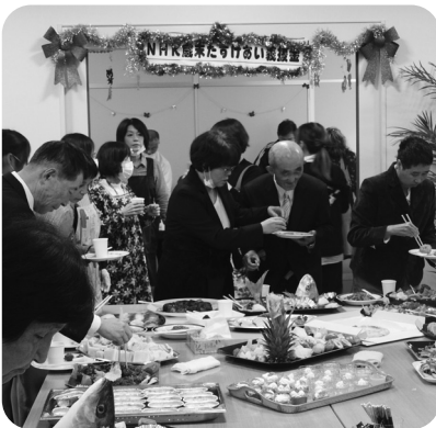
皆様、会話を楽しみながらたくさん召し上がっておられました