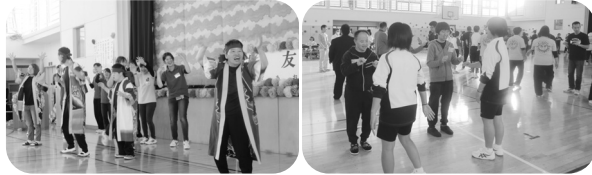
楽しい時間をありがとうございます!

会場では、様々なレクリエーションを短大生の方々と致遠館中の皆さんと楽しみ、めぐみ園からはソーラン節を披露しました! 毎年招待して頂き、利用者の皆さんも楽しみにされています。ありがとうございました。(健)