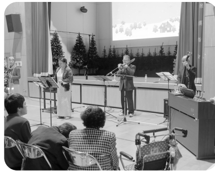
レインボー音楽隊によるミニコンサート