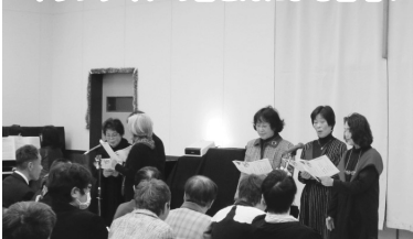
ボランティアの皆さんによる合唱!