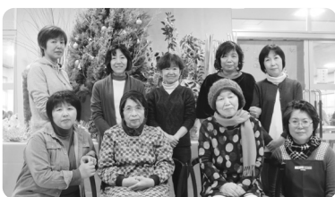
長い間、ありがとうございました!

一九七八年から毎年、クリスマスの時期に生けて下さりめぐみ園のクリスマスには、なくてはならない大切なプレゼント。ただ残念なことに、今年でひとつの区切りとされること。