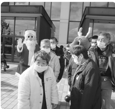
劇団四季の皆さん、ありがとうございました!

十二月八日(土)唐津市民会館で開催された日産労連チャリティ公演「王様の耳はロバの耳」に招待を受け七名の方々が観劇。キャストの方々の鮮やかな衣装とすてきな踊りと歌声! 客席まで降りて来られたキャストの皆さんと共に歌う場面もあり、皆さん物語に引き込まれた様子でした。そして最後に、勢ぞろいしたキャストの皆さんと握手でお別れ! 素晴らしい機会を与えてくださった日産労連の皆様と劇団四季の皆様感謝申し上げます。ありがとうございました。