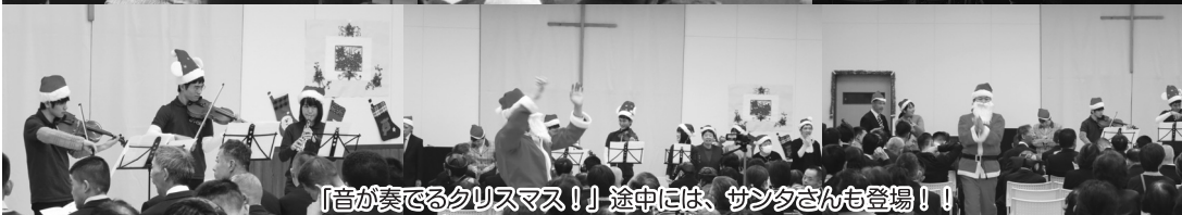
「音が奏でるクリスマス!」途中には、サンタさんも登場!!