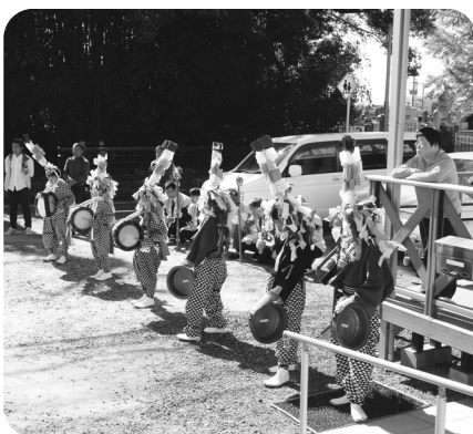
素敵なお舞をありがとうございました。

十一月三日、金立地区の行事で面浮立が行われ、ピースハイム金立・金立IIの前で披露されました。子ども達の迫力ある舞に入居者の皆さんは圧倒されていました。機会があれば皆様も是非ご覧になって下さい。