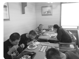
お昼はジョイフルで!

十二月八日(土)唐津市民会館で開催された日産労連チャリティ公演「王様の耳はロバの耳」に招待を受け七名の方々が観劇。キャストの方々の鮮やかな衣装とすてきな踊りと歌声! 客席まで降りて来られたキャストの皆さんと共に歌う場面もあり、皆さん物語に引き込まれた様子でした。そして最後に、勢ぞろいしたキャストの皆さんと握手でお別れ! 素晴らしい機会を与えてくださった日産労連の皆様と劇団四季の皆様感謝申し上げます。ありがとうございました。