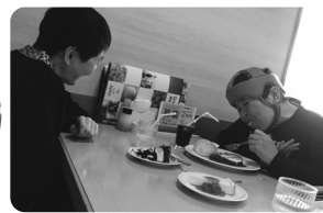
ジョイフルでランチ!