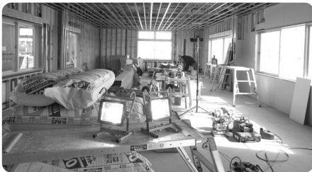
無事故でよろしくお祈りします！

職員室増設工事は三月の完成に向けて順調に進んでおり、現在内装工事が行われています！