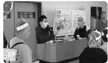
分かりやすいお話でした！