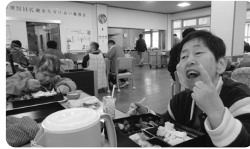
豪華なお弁当でした