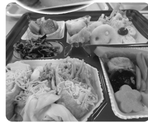
今年のお弁当色鮮やか！