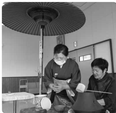
皆さん、なかなかのお点前！