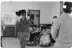
♪ 鬼はそと～ 福はうち～ ♪