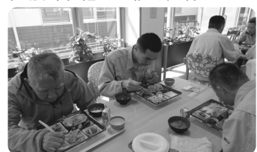
豪華なお弁当に皆さん、喜ばれていました！