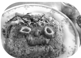
昼食も節分らしく・・・

会場となった創作活動室では、まず今年の年男、年女の紹介が行われ、その後節分の由来などの紙芝居が上映。そしていよいよ豆まきの時間！今年も皆で作ったお面を被り、鬼に扮した職員に向かって鬼は外、福は内く！今年一年の邪気を払うことが出来たようでした！