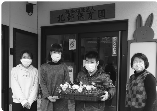
北部保育園へ愛を込めて!!

二月に日頃よりお世話になっている富士町内の保育園と小・中学校へ感謝の気持ちを込めてウイズ富士で丹精込めて育成した『パンジー』や『ピオラ』などを届けました。いつもご支援ありがとうございます。