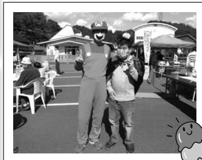
スーパーマリオも来場

当日は良い天気にも恵まれ穏やかな雰囲気にも包まれ開催されました。また、皆様体調不良もなく元気に参加されました。出店が開店すると、たこ焼きや焼きそば、ウインナー、カレーライスなどそれぞれ好きな物を取りに行かれ美味しく召し上がられていました。また食事だけでなく、カラオケを歌いながら楽しく参加されました。少し風があり肌寒い感じではありましたが、ソフトクリームが出来上がるのを嬉しそうに順番で待たれていました。新型コロナウイルス感染症拡大防止のため、富士学園とは時間をずらし、わずか一時間ほどの参加でしたが皆様大変喜ばれて職員と一緒に楽しい時間を過ごされました。