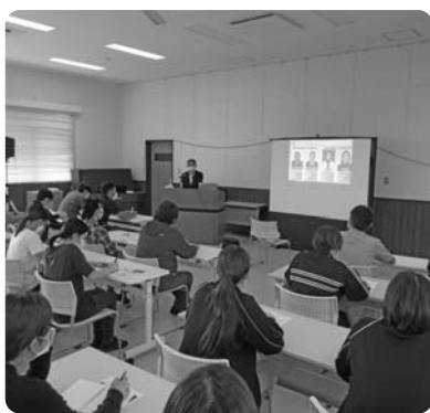
活発な質疑応答が行われました

十月二十五日(水)十一月中旬以降、勤務されるインドネシア出身スタッフの受け入れ研修が行われました。お二人の紹介は、次号までお待ちください！