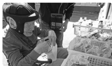
待ちに待った再開に皆さん笑顔

九月下旬より感染防止体制に移行したことで、長く休止になっていましたが、久々の再開に皆さん喜ばれていました！