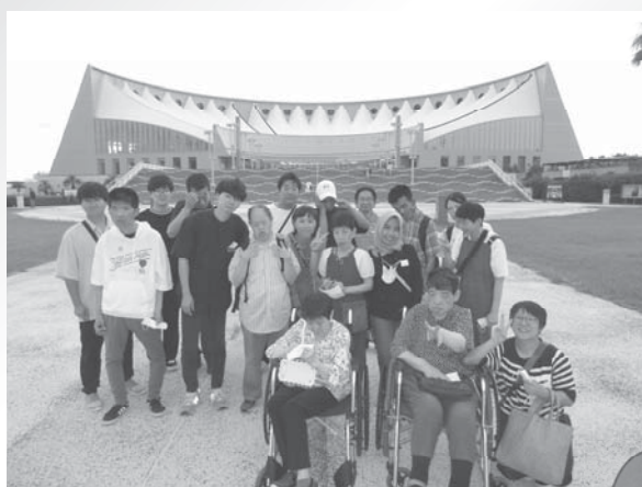
マリンワールド前で記念撮影

七月十日(水)めぐみ園では、久しぶりに再開されたバス旅行として、福岡市にある「マリンワールド」に行ってきました。当日は雨の予報も出ていましたが、幸い傘が必要となる場面はなく、皆さん、様々な海の生き物に興味津々！満席のイルカショーも見ることが出来、短いながらも楽しい時間を過ごすことができました。