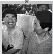
バス旅行 お母様と一緒に