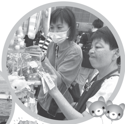
皆さん、楽しい時間を過ごせたようです！