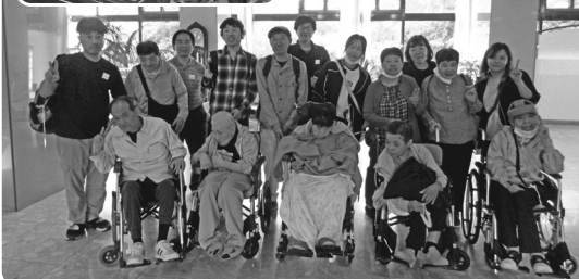
楽しい時間を過ごせました！