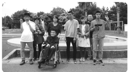
よか公園での記念撮影

めぐみ園ではプレーデーが行われました。今年のプレーデーは、『よか公園』で散策をするグループと、創作活動室でカラオケをするグループに分かれて行われ、来園されたご家族と共に、短いながらも楽しい時間を過ごすことが出来ました。