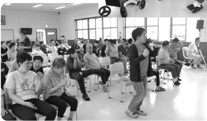
往年の名曲から童謡まで皆さん、熱唱！