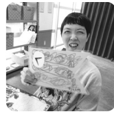
～カラフルな鯉のぼり～

五月十四日(水)父の日飾りを作りました。利用者の方は色を塗ったり花を作ったりして大きなブーケが完成！皆さん楽しまれながら作業されました。