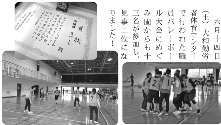
他の事業所の方々と、よい交流の場になりました

六月十四日(土)大和勤労者体育センターで行われた職員バレーボール大会にめぐみ園からも十三名が参加し、見事二位になりました!