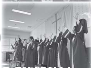
皆さんの多くの笑顔が見られたクリスマス礼拝・祝会になりました！