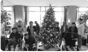
ホテルニューオータニにて

十二月十一日(水)には武雄・嬉野方面へ！嬉野華翠園で温泉、食事！日本三大美肌の湯で日頃の疲れを癒し、心身共