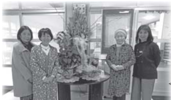
今年もありがとうございます！

十二月二十四日(火)クリスマス礼拝・祝会が行われました。昨年は感染防止の観点から、利用者・職員のみで執り行いましたが、今年はご家族、どりいむ、富士学園の方々、そして祝会を華やかにして頂いたマーシーボイス様たちの歌声と共に祝うことが出来ました。併せて今年も溝田先生による生け花が披露され、館内に彩りを添えて頂きました。