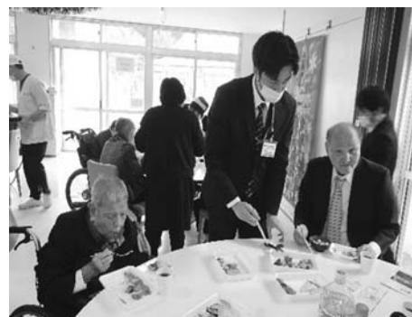
愛餐会の様子です！！