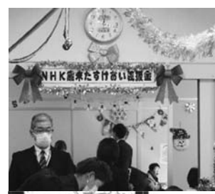
次は何を食べようか！！